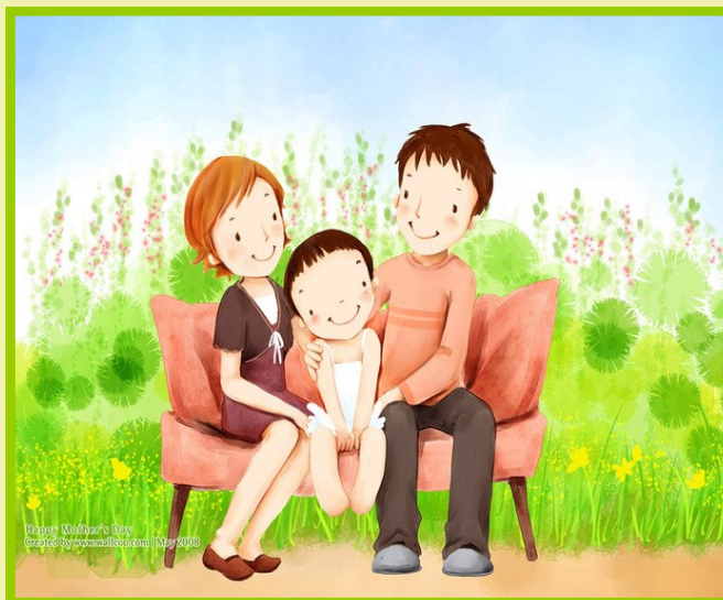
Иллюстрация: Милана Дев Создано: www.wallpaper.com | May 2018

Каждый ребенок имеет право на сохранение семейных связей