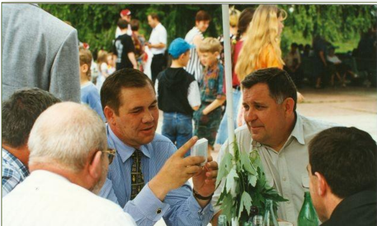
Встреча с А. Лебедем- губернатором Красноярского края