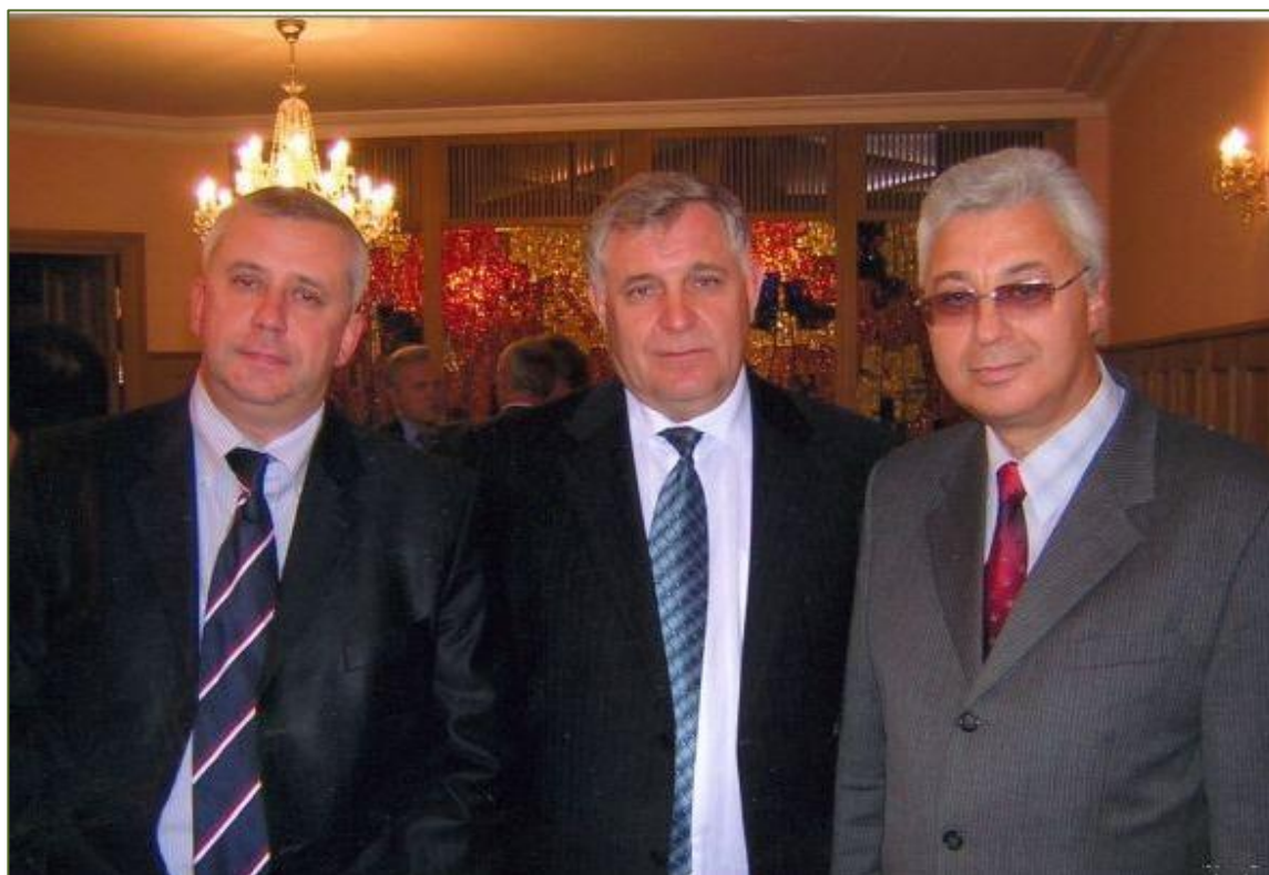
Встреча в Москве