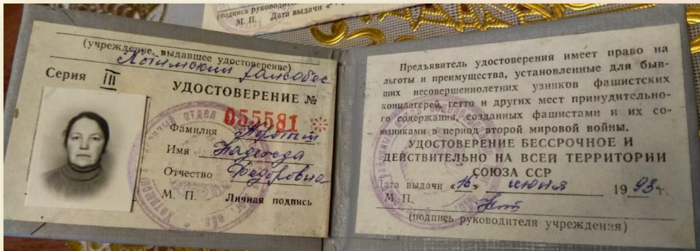
Удостоверение малолетнего узника нацистского лагеря