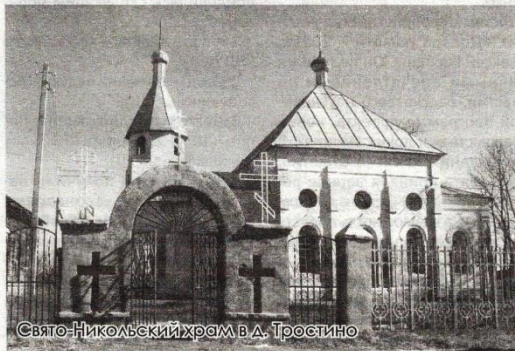
Свято-Никольский храм в д. Тростино

Сви́репо, Т. Пришел в мир для служения / Тамара Сви́репо // Шлях Кастрычніка. — 25 лютага. — С. — 5. — Продолжение. Начало в № 9, 2026.