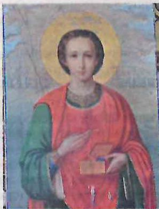
Икона великомученика целителя Пантелеймона передана в Хотимск с горы Афон в 1909 году.

Каждый экспонат будущего музея при соборе — это история какого-то храма или какой-то семьи, священнослужителя, на век которых выпала миссия служения Богу и людям, подытоживает отец Павел: