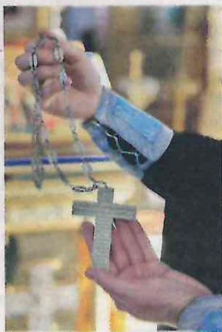
Крест 1787 года.

— Эта фелонь, то есть риза священника, по преданию, принадлежала пра-