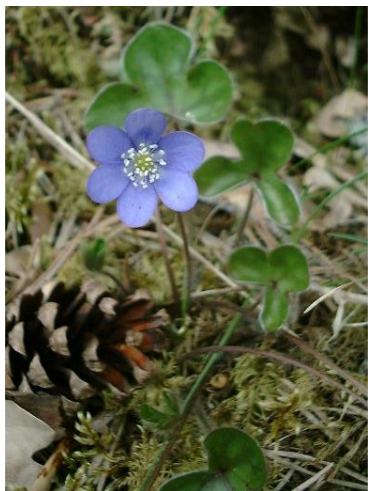
Перелеска благородная – Нeratica nobilis Mill. Сем. Лютиковые

Многолетнее травянистое растение высотой 10-15 см. Цветет в апреле – мае. Произрастает в широколиственно-еловых и мелколиственных лесах, среди кустарников, в поймах рек. Встречается в северных и центральных районах республики довольно часто, местами образует заросли, на юге встречается редко. Количество мест и общая площадь в Беларуси – 115550 местонахождений (21466,2 га).