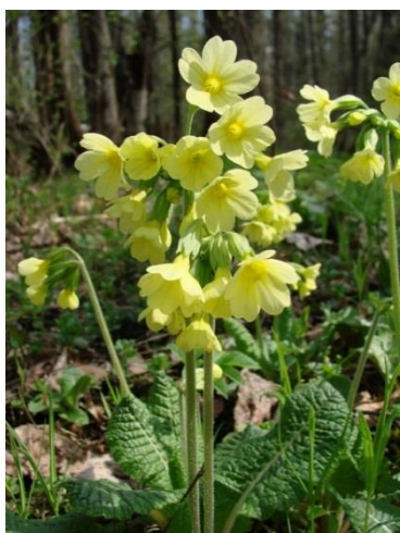
Первоцвет высокий - Primula elatior (L.) Hill. Сем. Первоцветные

Многолетнее травянистое растение высотой 10-15 см. Цветет в апреле – мае. Произрастает в широколиственно-еловых и мелколиственных лесах, среди кустарников, в поймах рек. Встречается в северных и центральных районах республики довольно часто, местами образует заросли, на юге встречается редко. Количество мест и общая площадь в Беларуси – 115550 местонахождений (21466,2 га).