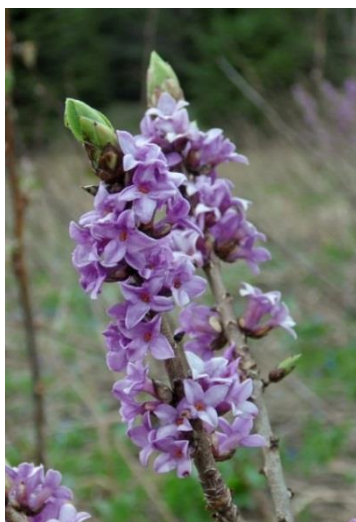
Волчник обыкновенный - Daphne mezereum L. Сем. Волчниковые

Многолетнее травянистое растение высотой 20-30 см. Цветет в апреле – мае. Произрастает на низинных закустаренных лугах, у истоков ручьев. Встречается в Пуховичском районе Минской области, в ряде районов Витебской области, в Каменецком районе Брестской области, очень редко. Количество мест и общая площадь в Беларуси – 18 местонахождений (1,8 га).