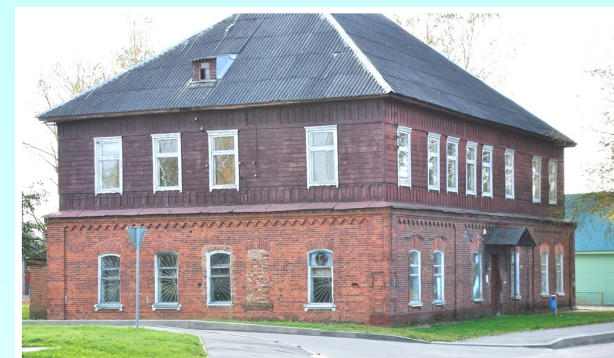
Здание 1911 года постройки по улице Садовая, 20.

Любимым местом отдыха всего населения Хотимского района является Парк аттракционов , где всегда весело не только детворе, но и взрослым. С колеса обозрения можно увидеть весь Хотимск и даже часть России. Такой полёт над городом, несомненно, оставит в памяти прекрасные воспоминания.