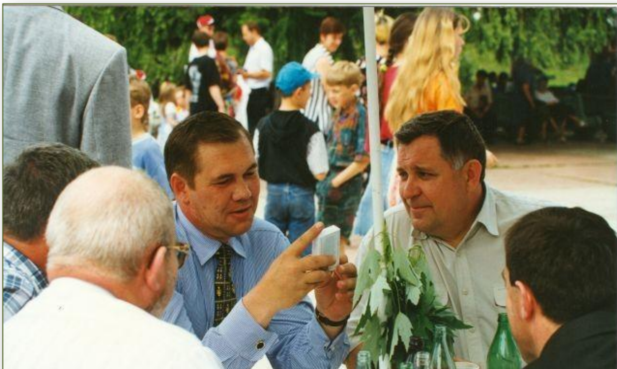
Встреча с А. Лебедем- губернатором Красноярского края