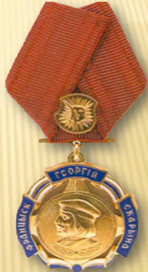
Орден «Франциска Скорины» (Республика Беларусь)