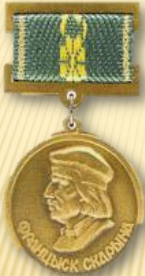
Медаль «Франциска Скорины» (Республика Беларусь)

В Беларуси введены специальные награды — медаль Скорины (1989 г.) и орден Скорины (1995 г.)