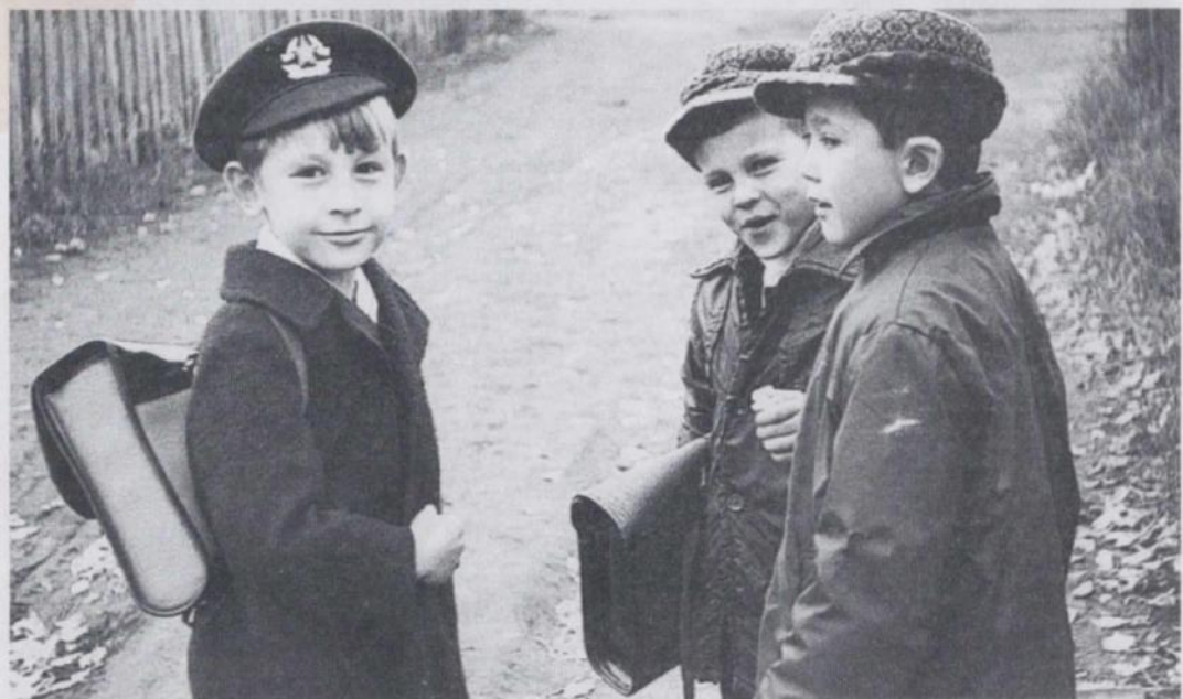
■ Возможно, именно так будет выглядеть кадр из фильма «Деревенское танго», снятого по сценарию Ивана ЮРКИНА